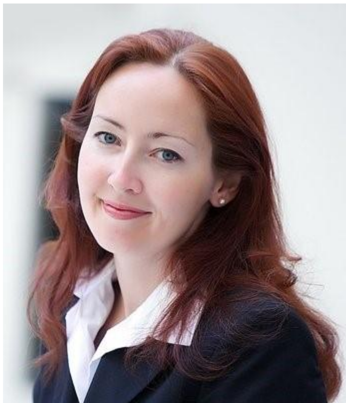
Advokatfirman Dolin AB